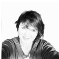
Caffelli Iris CFF RSI 66E45B898Z